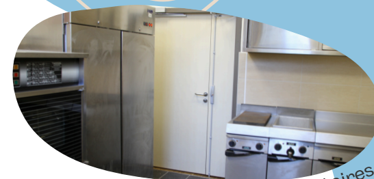
Carré des Mousquetaires